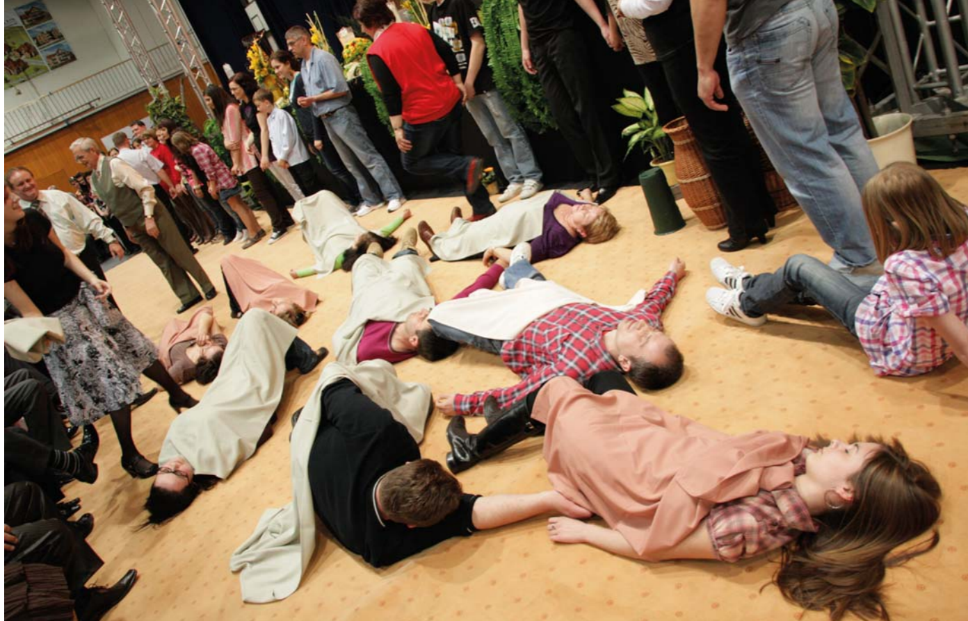
Danielle in the Lions' Den / Gustave Doré